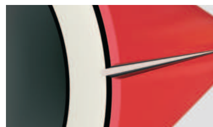
Рис. 12. Труба повреждена, эксплуатация ограничена