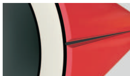
Рис. 11. Труба имеет незначительное повреждение, эксплуатация возможна